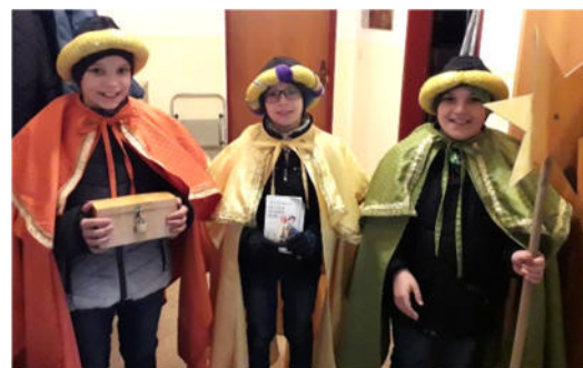
← Gruppe Els

So stellten in allen Ortschaften eine große Schar Jugendlicher einen Tag ihrer Weihnachtsferien in den Dienst der guten Sache, wofür sich die Pfarrverantwortlichen hiermit herzlich bedanken möchten.