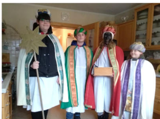
Gruppe Arzwiese/Harrau/Marbach/ Kl. Heinrichschlag

So stellten in allen Ortschaften eine große Schar Jugendlicher einen Tag ihrer Weihnachtsferien in den Dienst der guten Sache, wofür sich die Pfarrverantwortlichen hiermit herzlich bedanken möchten.