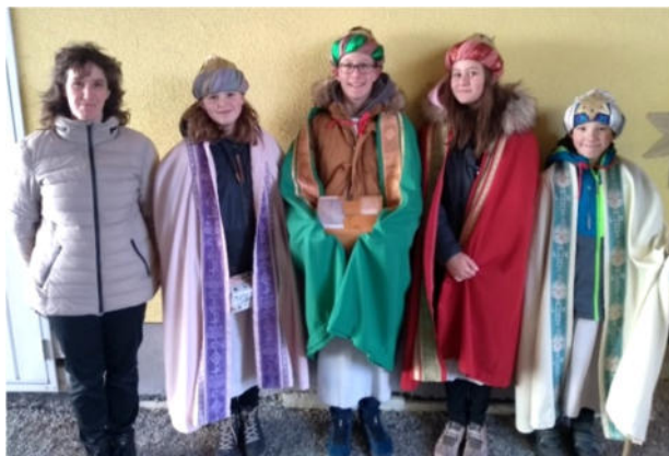
Gruppe Eppenberg →

Heuer war es endlich wieder möglich, dass die Sternsinger in unseren beiden Pfarren Albrechtsberg und Els von Haus zu Haus zogen und Geld für Hilfsprojekte in Afrika, Asien und Lateinamerika sammelten.