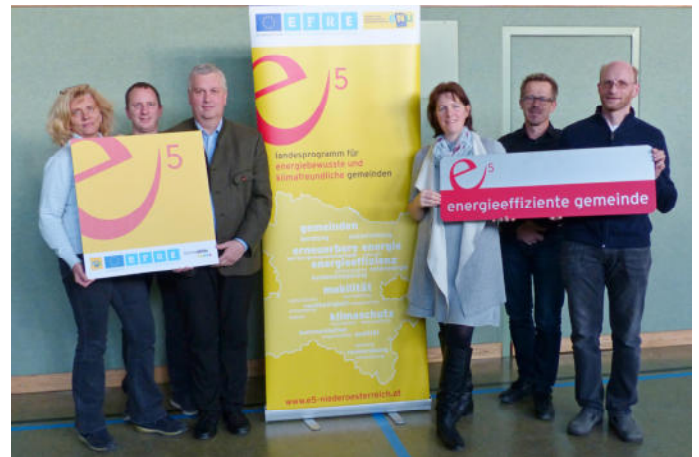
Das e5 Team bereitet eine Klimabefragung vor.

Eine große Herausforderung für die Zukunft ist der Klimawandel und die damit verbundenen Auswirkungen auf unsere Umwelt. Wir bemühen uns die Energieversorgung in unserer Gemeinde nachhaltig zu gestalten. Im Bereich Photovoltaik sind wir schon sehr gut aufgestellt und waren hier bereits einmal Bezirksieger. Der Klimaschutz wird für uns ein wichtiges Thema bleiben und wir werden auf diesem Gebiet weitere Projekte planen und auch umsetzen.